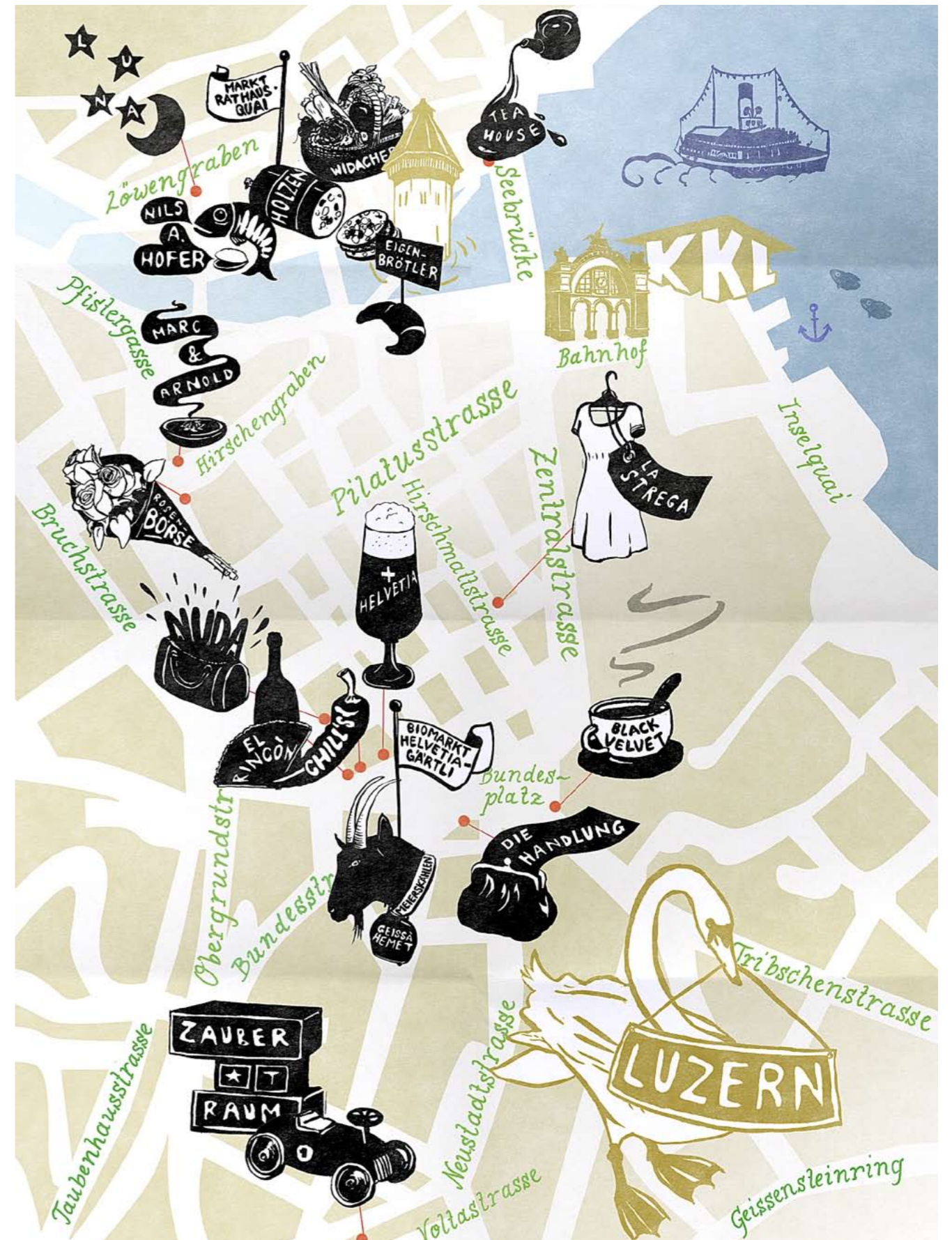
Illustration: Anna Haas

MARC & ARNOLD Bahnhofstrasse 24–26, Mo 11 bis 18.30 Uhr, Di und Mi 9 bis 18.30 Uhr, Do und Fr 9 bis 21 Uhr, Sa 9 bis 16 Uhr www.marcarnold.ch